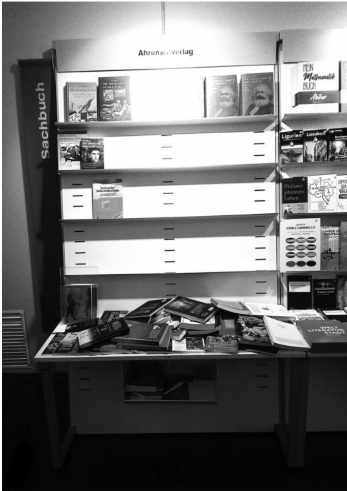
Der verwüstete Stand ...