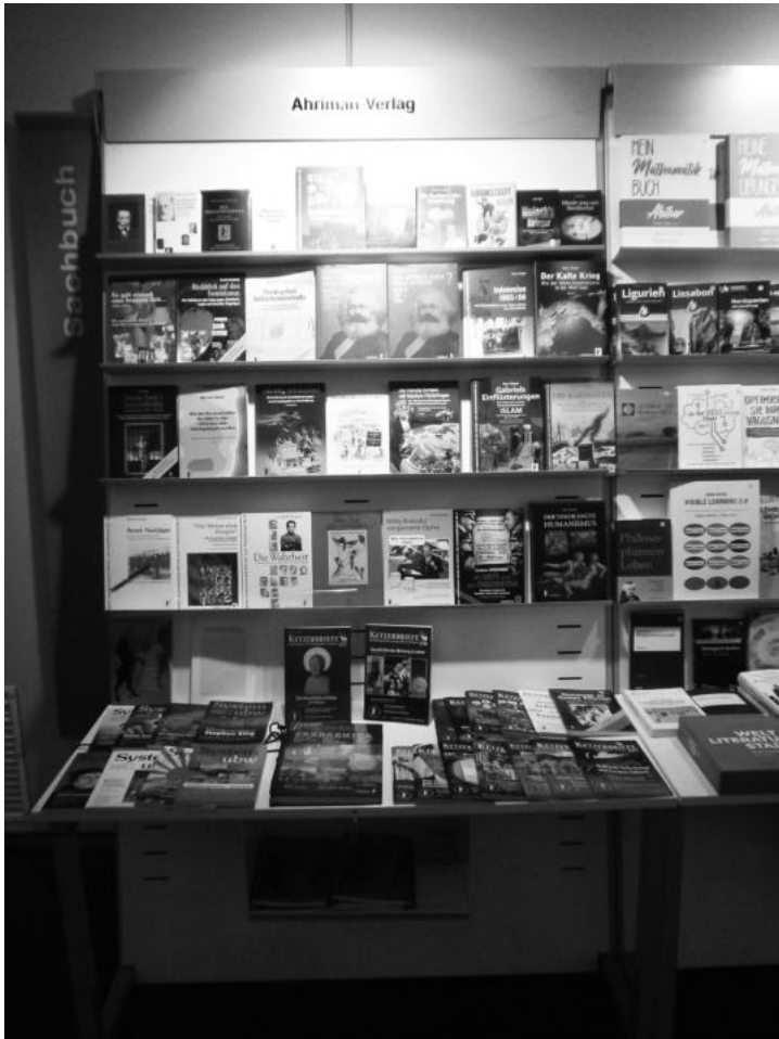
Der wiederhergestellte Stand