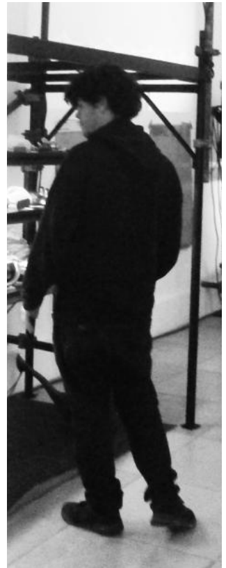
... der Täter